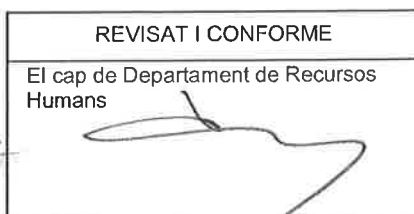
Pere Cantarero Verger