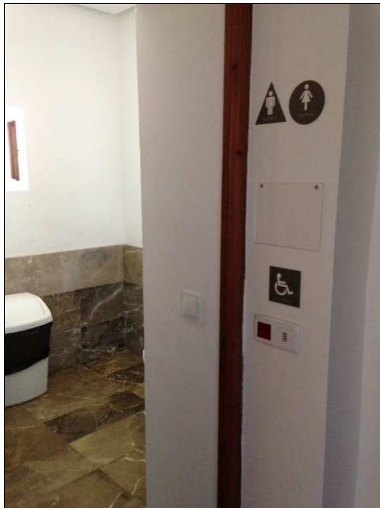
Servicio higiénico accesible y común para ambos sexos