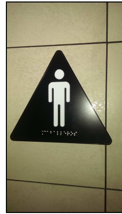
Servicio higiénico para HOMBRES