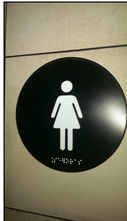
Servicio higiénico para MUJERES

Identifica y será de obligada instalación en los servicios higiénicos de uso público separados por sexos, independientemente de que sean o no adaptados, para facilitar su identificación a las personas con alteraciones o discapacidades de la visión. Presenta la iconografía en relieve y en alto contraste cromático, así como texto en Braille.