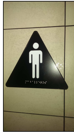
Cambra higiènica d'HOMES