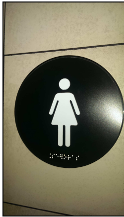
Cambra higiènica de DONES

Identifica i serà d'obligada instal·lació a les cambres higièniques d'ús públic destinades a cada sexe, independentment que siguin o no cambres adaptades, a fi de compensar les alteracions o discapacitats de la visió. Presenten la iconografia en relleu i en alt contrast cromàtic, així com el text en braille.